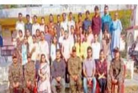
जवाली कॉलेज में तंबाकू विरोधी विचार पर जागरूकता रैली निकालते कॉलेज छात्र।